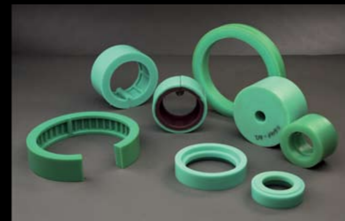
DIVERSIDAD DE RUEDAS DE INTRODUCCIÓN PARA DIFERENTES MÁQUINAS WIDE RANGE OF FEED WHEELS FOR DIFFERENT MACHINES