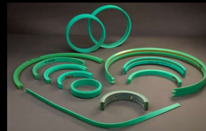
CUBIERTAS CORTESOLAPA Y PERFILES CONTRAHENDEDORES