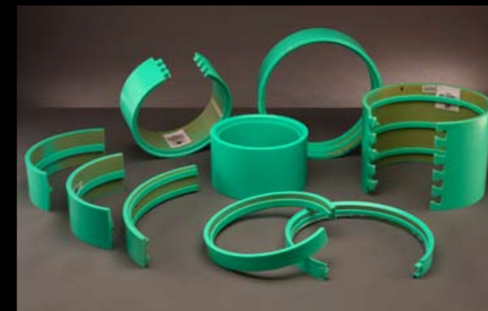
BANDAS POLIURETANO ESPECIALES PARA DIFERENTES TIPOS DE SOPORTE