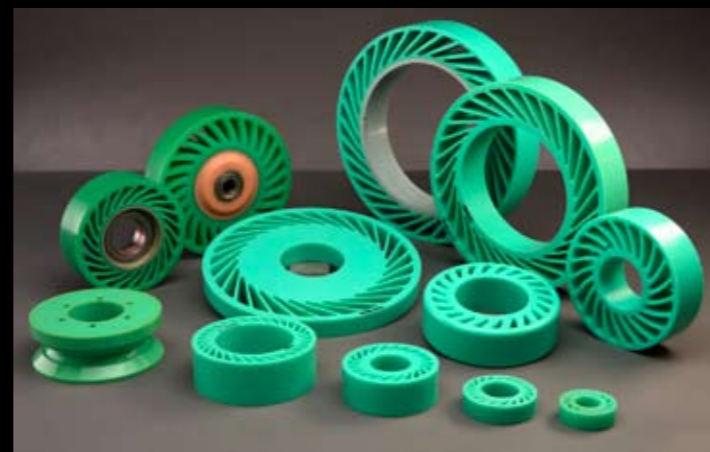
RUEDAS NO CRUSH