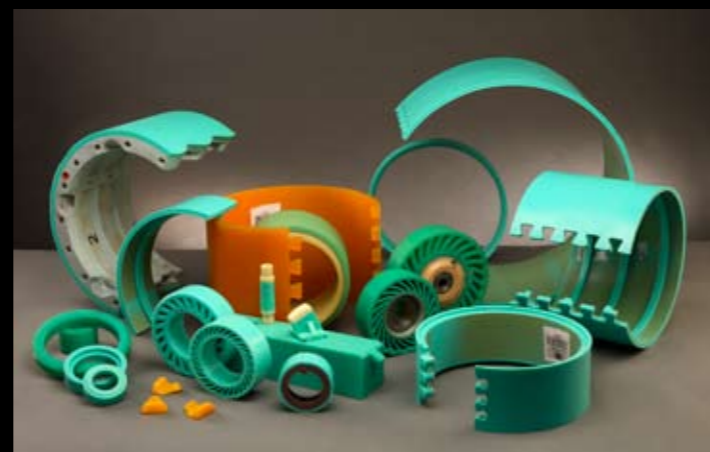
PIEZAS DIVERSAS EN POLIURETANO COMPACTO